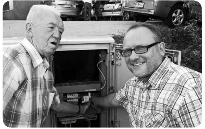
▼ Še pritisk na gumb in naj sveti!