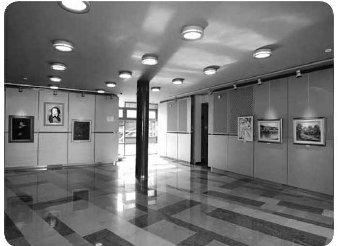
▼ Predvsem je po sprejetem pravilniku več reda, izpostavljajo na občinski upravi.