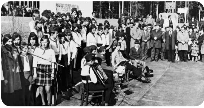
Na ogled topliške šole so prihajale številne delegacije. ▼

prebivalcem takratne krajevne skupnosti, da so s svojim pozitivnim odnosom in materialnimi sredstvi omogočili, da smo dobili sodobno šolsko zgradbo.