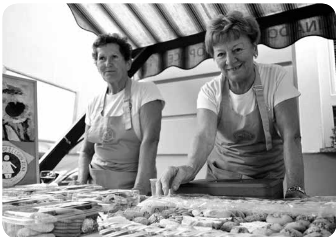
▼ Članice društva podeželskih žena in sladke dobrote.

Praznovanje so popestrile še športne dejavnosti, ki jih predstavljamo v nadaljevanju, otvoritve razstav, glasbeni dogodki, lovska veselica in gasilska veselica, otvoritev spomenika. Žal je letošnje praznovanje pokvarilo le neurje, ki se je razbesnelo sredi praznovanja ob občinskem prazniku, ki pa je poleg rušilne moči dokazalo vendarle nekaj pozitivnega; v topliški dolini imamo izvrstno usposobljene gasilce, Topličani smo v dobri oskrbi. Občina Dolenjske Toplice se zahvaljuje vsem, ki so sodelovali pri pripravi letošnjega občinskega praznika, domačine pa še naprej vabi k obisku poletnih prireditev, ki sledijo avgusta.