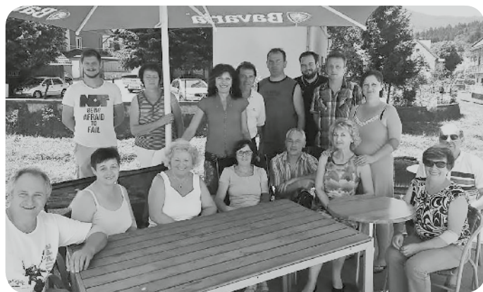
▼ Nasmejani krvodajalci po humanitarni potezi.