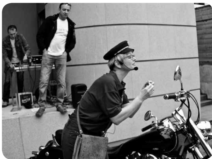
▼ KUD Vesel teater in zvrhana doza smeha.