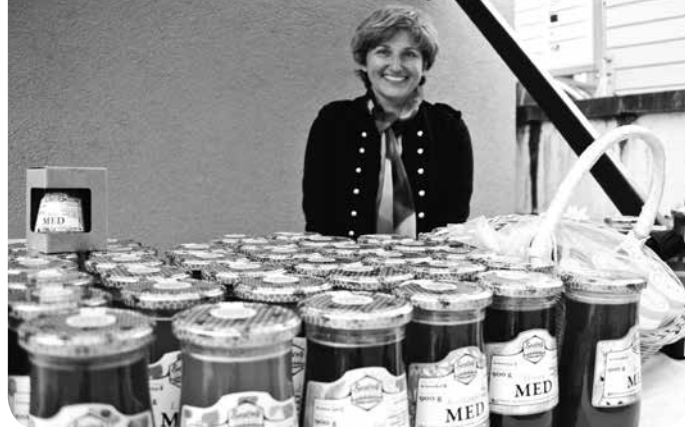
▼ Vsako soboto na kmečki tržnici pred KKC-jem.