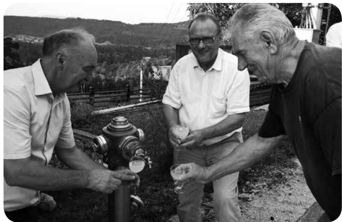
▼ Nazdravje!