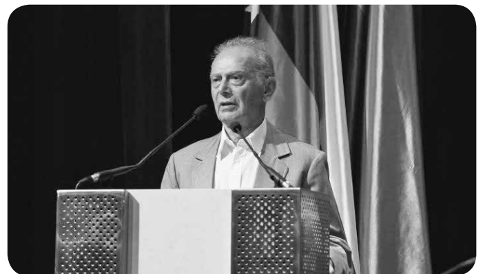
Besede zbranim na slavnostni seji občinskega sveta. “Nagrade ne sprejemam le v svojem imenu!”

Krajevna skupnost Dolenjske Toplice je že več let s strani Občine Novo mesto zahtevala, da v kraju začne z izgradnjo šole. Sam sem se takoj aktivno vključil v vse dejavnosti za realizacijo te zahteve. V občini je več šol potrebovalo nove šolske zgradbe, a za vse ni bilo dovolj finančnih sredstev. Zato smo bili še toliko bolj aktivni. Krajevna skupnost Dolenjske Toplice je kar dvakrat organizirala samopriskom in s tem pospešila začetek gradnje. Krajanje so prispevali tudi materialna sredstva (les) in denar za delno opremo učilnic in nabavo knjig za šolsko knjižnico. Zato gre vsa zahvala vsem