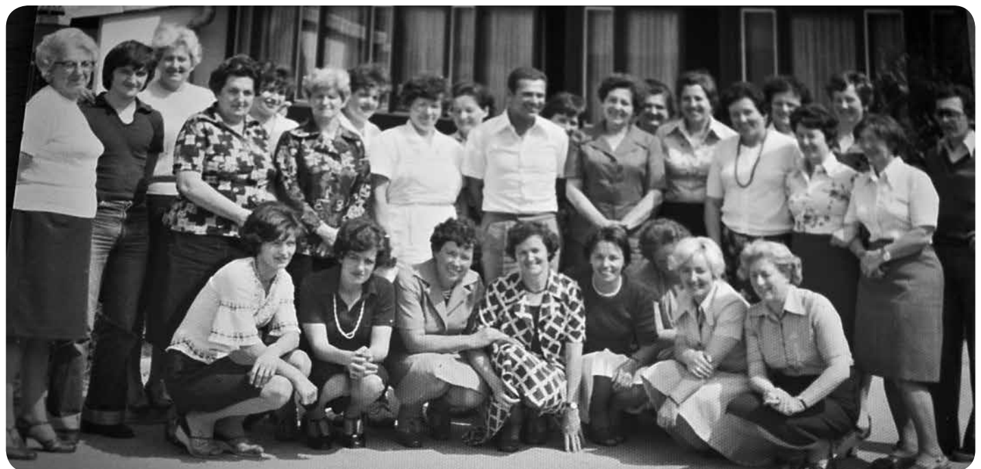
▼ Učiteljski zbor po pridobitvi novih šolskih prostorov.

Med učitelji in učenci so vladali spoštljivi a sproščeni odnosi. Mnoge dejavnosti so vodili učenci samostojno. Sodelovali so na številnih občinskih in republiških tekmovanjih in dosegali zavidljive rezultate. Občina Novo mesto je bila na šolo ponosna, zato je številne delegacije iz Slovenije in tujine pošiljala na ogled šole in njenega delovanja.