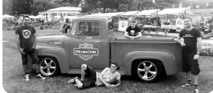
Pomembno nam je, da se razumemo in imamo fajn. Ostalo pride."