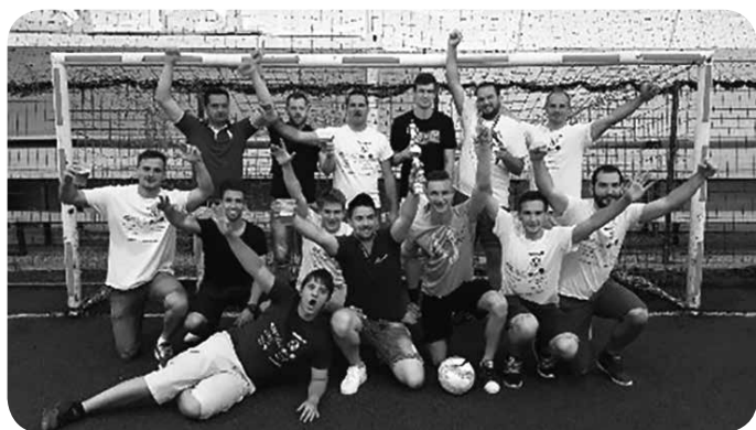
▼ Slavje ob osvojitvi pokala lige Kelme.

Menišani smo se nedavno udeležili treh turnirjev, kar dvakrat so se domov vrnili kot zmagovalci. Lepa vzpodbuda za treninge in tekme, ki so še pred nami.