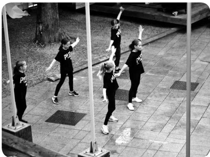
▼ Mlade Grmekove plesake.