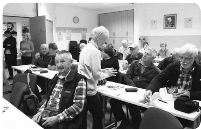
▼ Obnavljali smo znanje CPP.