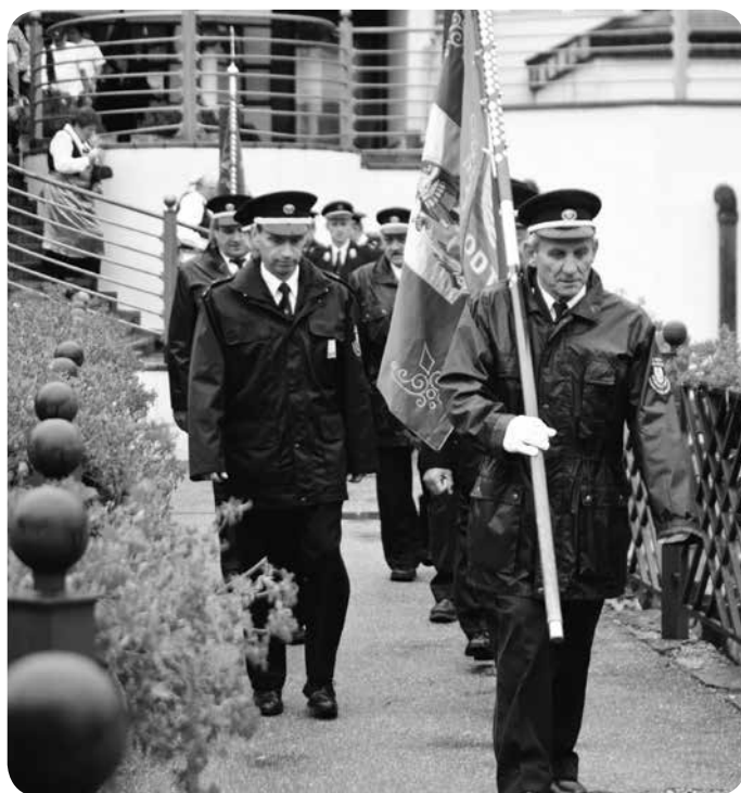
▼ Povorka društev tokrat žal v slabem vremenu, a nič manj zanimiva.